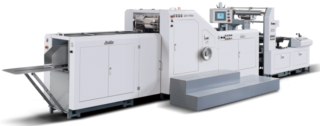
पेपर बैग बनाने की मशीन