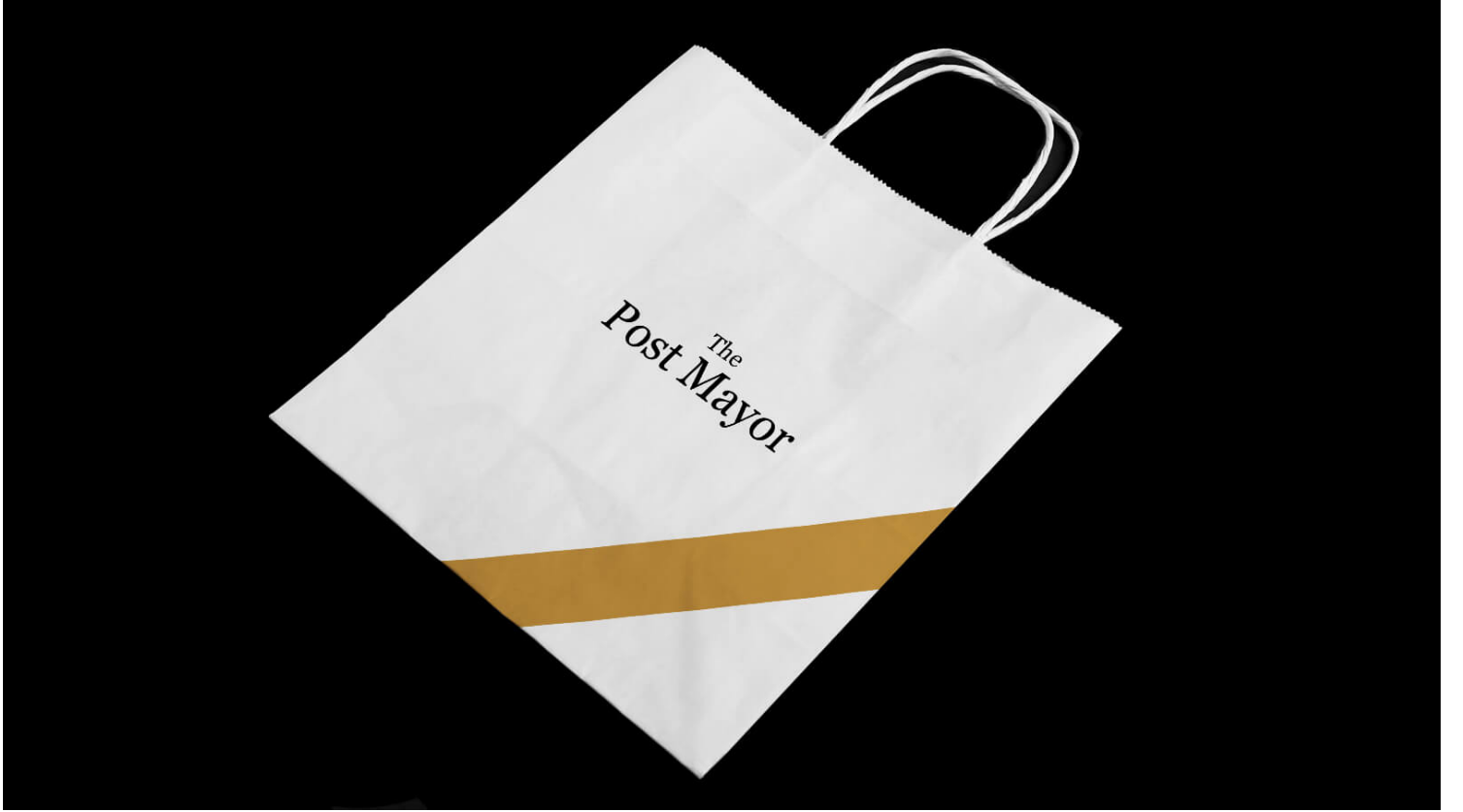
पेपर बैग बिज़नेस